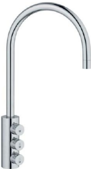
Rubinetto mod. 6180

L'erogatore sottobanco ICE 50 deve essere abbinato ad una colonna di spillatura a due o tre vie