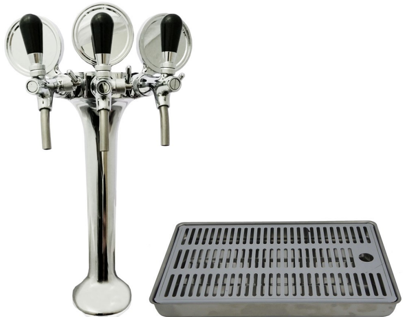
Colonna COBRA a tre vie e vaschetta raccogli gocce